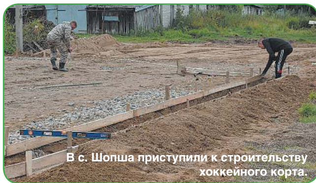
В с. Шопша приступили к строительству хоккейного корта.