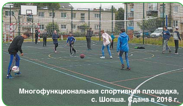
Многофункциональная спортивная площадка, с. Шопша. Сдана в 2018 г.

чень на год очередных объектов. Свидетельство тому и наш старейший стадион «Труд». Вот уже второй год на нем ведутся восстановительные работы, и он постепенно преобразуется. С июня подрядчики приступили к работам и на других объектах, а ряд из них уже выполнены на сто процентов. Например, в рамках одного из направлений проекта - «Поддержка местных инициатив».