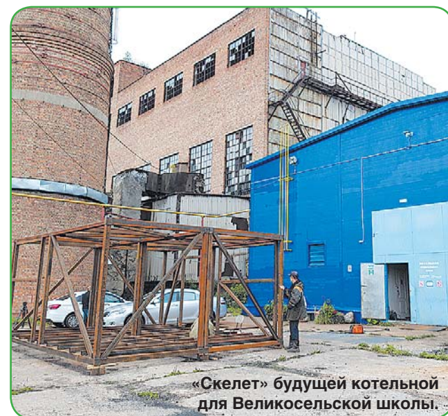
«Скелет» будущей котельной для Великосельской школы.