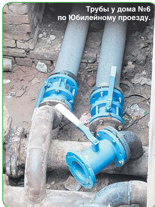
Трубы у дома №6 по Юбилейному проезду.

*На реализацию мероприятий плана предусмотрены средства ресурсоснабжающих организаций в размере 15027,1 тыс. рублей, средства местного бюджета - в размере 320 тыс. рублей.