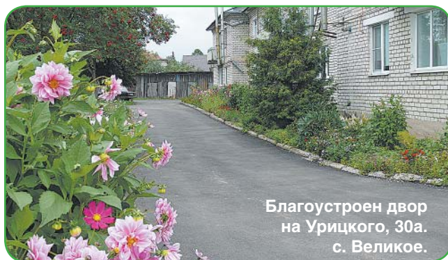
Благоустроен двор на Урицкого, 30а. с. Великое.